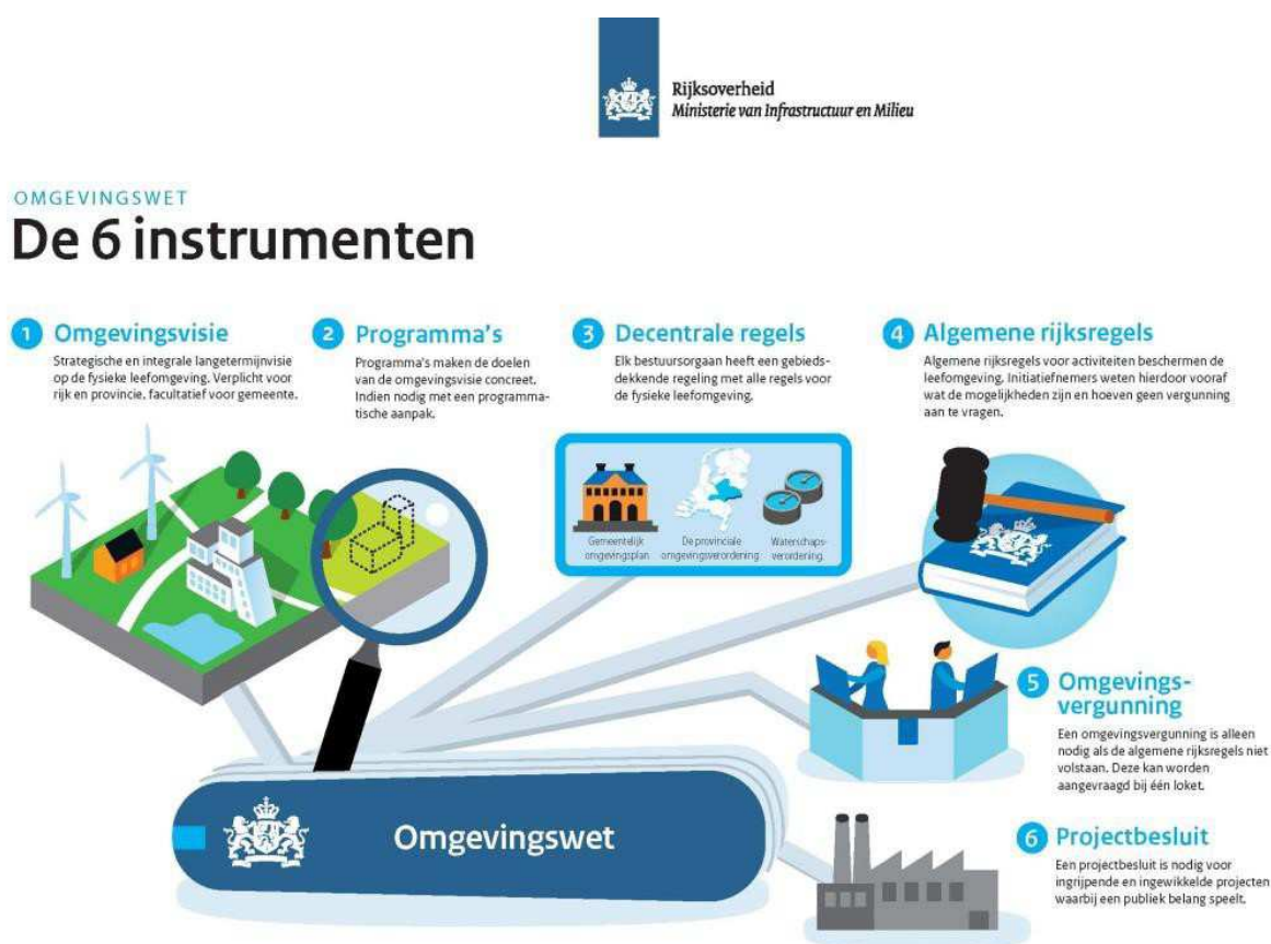
Figuur 1: De instrumenten van de Omgevingswet