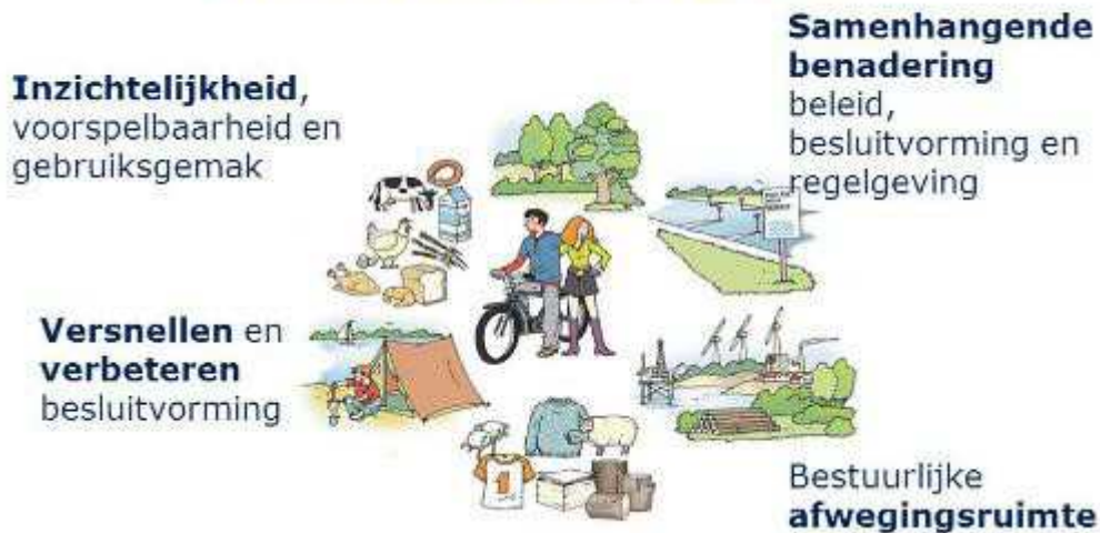
Figuur 2: Verbeterdoelen Omgevingswet